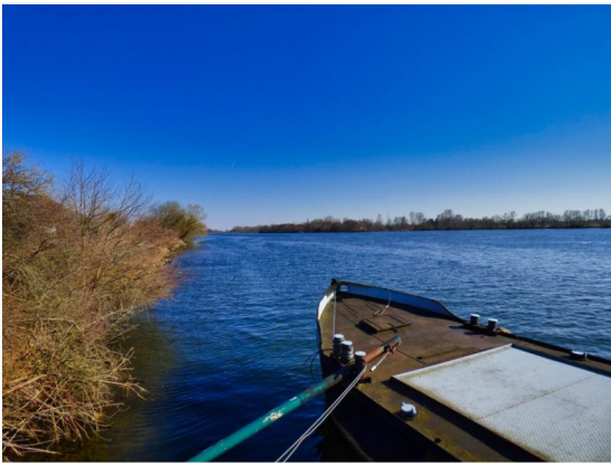
Die Donau in der (weiteren) Nachbarschaft!