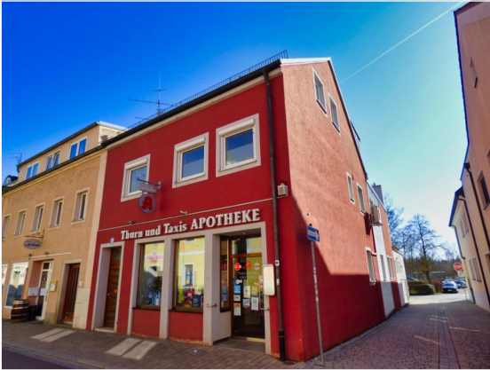
Ihr Wohn- und Geschäftshaus von der Straße