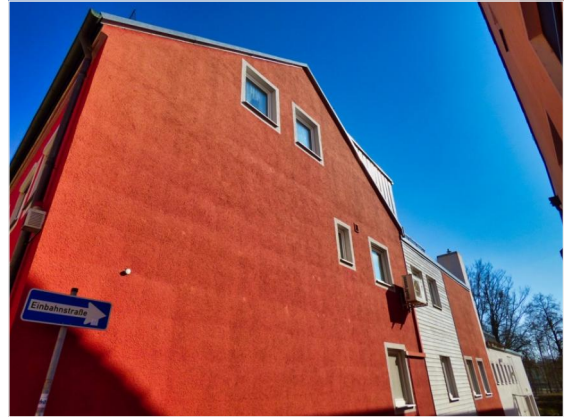
Ihr Wohn- und Geschäftshaus von der Gasse