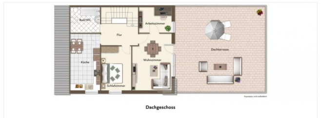
Der Grundriss Ihres Dachgeschosses