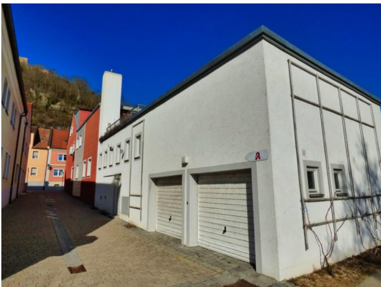
In der Gasse von Süd-Westen