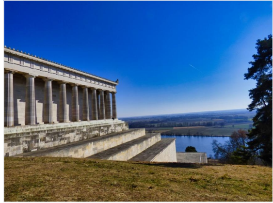
Der Walhalla zu Füßen!