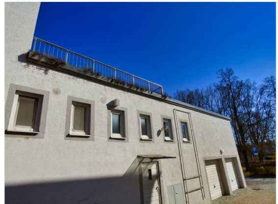
In der Gasse gen Süd-Osten