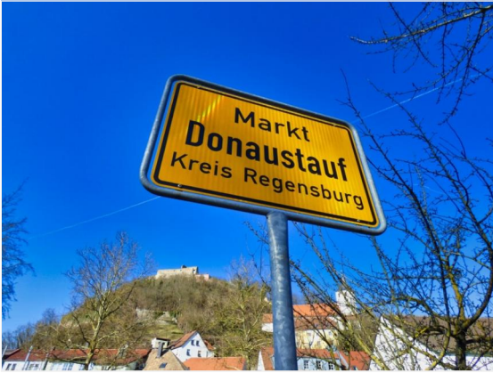
Im Herzen des Marktes!