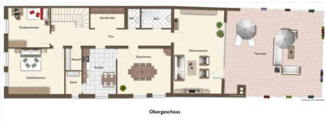
Der Grundriss Ihres Obergeschosses